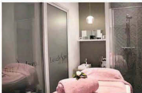
Par Aurélie Lambillon et Joy Pinto

A partir de 65 € les 15 minutes. CoolLifting chez Lovely Spa, 19, rue Benjamin-Franklin, Paris 16 e . Tél.: 0984434711.